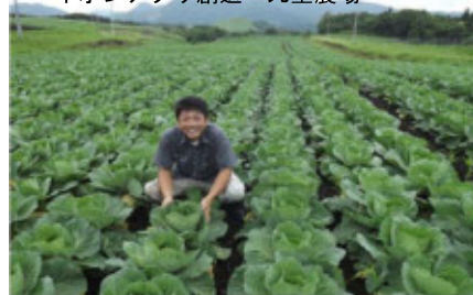
イオンアグリ創造 九重農場