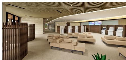
<本店営業部ロビーイメージ>