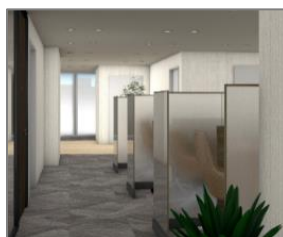
ローン福岡営業室／NCB ほけんプラザ・福岡 相談ブース