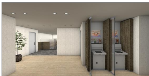
<地下2階の入りイメージ>