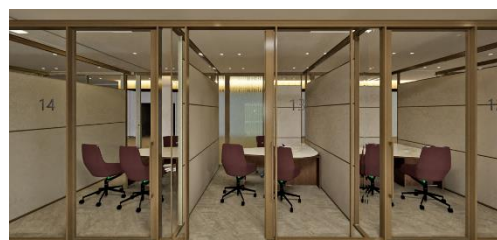
<相談ブースイメージ>