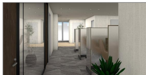
<相談コーナーのイメージ>