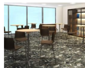
NCB 創業応援サロン HAKATA