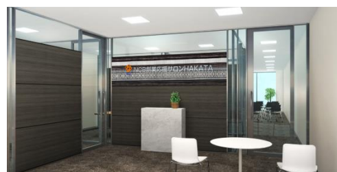
<エントランスイメージ>