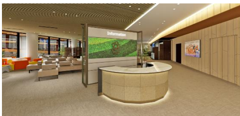
<本店営業部総合受付イメージ>