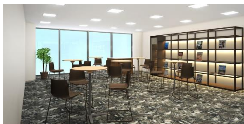
<コミュニティラウンジイメージ>