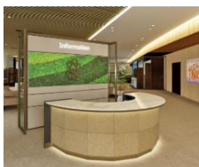
本店営業部総合受付