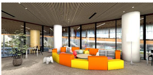
<キッズコーナーイメージ>