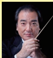
井崎 正浩 ハンガリー・ソルノク市 音楽総監督