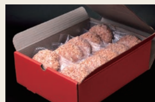
③【佐賀牛入り】 黒毛和牛がばいばー 150g×10個