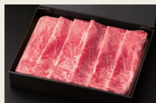
②【佐賀牛】ももスライス400g