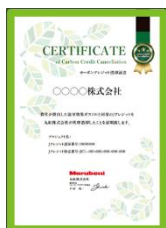
<カーボンクレジット償却証書>