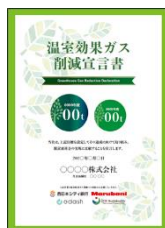
<温室効果ガス削減宣言書>