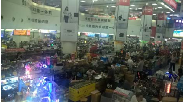
【華強北・賽格廣場 / あらゆる電子部品が手に入る】