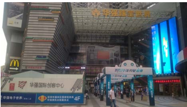
【華強北路の商業施設外観】