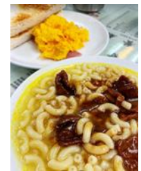
定番のマカロニスープ