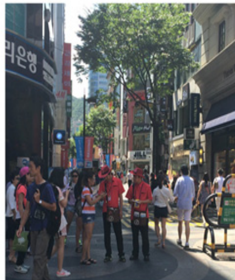
ソウル市内で活動する観光案内員 ※写真中央の赤いユニフォーム

実際にソウルの街中で感じることは観光客への配慮です。ソウルでは市内の主な観光地域で英語、日本語など外国語対応の可能な観光案内員が活動しており、外国人観光客向けにガイドサービスを提供しています。また、昨年10月には外国人観光客の快適で安全な旅行の為、観光警察隊が創設され市内主要観光地で観光客への道案内などに加え治安強化や法外な料金請求（ぼったくり）の取締まり等を行っています。これらの対応によりソウルを訪れる外国人観光客は安心して観光を楽しむことが出来ます。