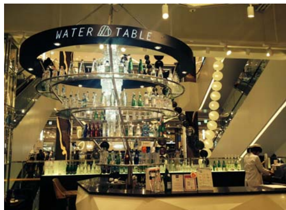
ロッセデパート内のウォーターテーブル

健康を維持する水に対する関心と需要の増加で、これからもミネラルウォーター市場は拡大し続けると思われます。多様なプレミアムウォーターの生産・輸入増加、ウォーターバーやウォーターカフェの出店等、水は単純な消費材を超えてライフスタイルをグレードアップしてくれる新しい文化的な現象となりつつあります。