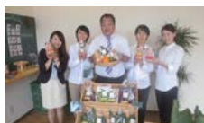
株式会社ワダゲン