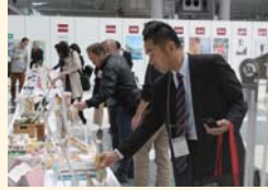
昨年は157商品を展示