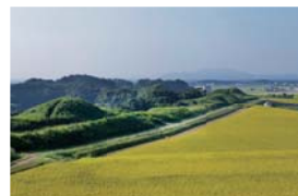
新原・奴山古墳群