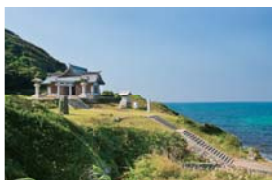
宗像大社沖津宮遙拝所