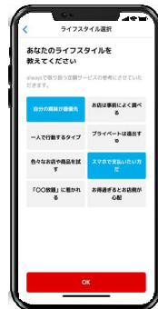
4. ライフスタイルを入力