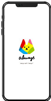
1. 専用ページより利用登録