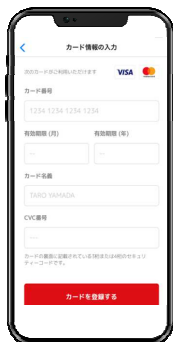
5. クレジットカード登録・会員登録完了