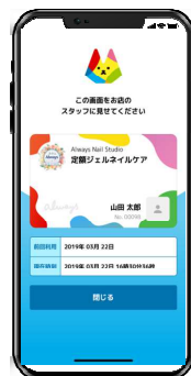
8. 店頭で購入サービスのパスを提示