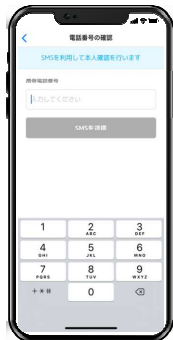
2. 携帯電話番号を入力後、送られてくる認証コードを入力