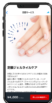
7. サービス購入 (クレジットカード決済)