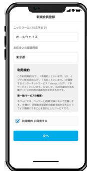
3. 氏名・住所・生年月日などを入力