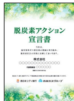
<宣言書のイメージ>

(注) “脱炭素アクション宣言書”とは、お取引先企業の脱炭素に向けた取組みをPRするツールです。