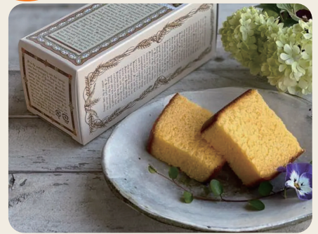
清風堂 長崎カステラ(ミニ) 1箱

【リニューアル記念キャンペーンについて】◎筑紫通支店の店頭限定のキャンペーンです。◎プレゼントは、ご購入・お預入れ金額・回数に関わらず、お一人につき一個となります。◎諸般の事情によりキャンペーン内容を変更または中止する場合があります。◎プレゼントの写真はイメージです。実際のものとは異なる場合があります。【定期預金のご留意事項】◎対象お取引は、新たな定期預金のお預入れとし、お預入れ期間は問いません(既にお預入れの当行定期預金からの切替は対象外)。◎総合口座の担保預金とすることができます。◎マル優もご利用いただけます。◎本預金は預金保険の対象であり、同保険の範囲内で保護されます。◎2013年1月1日から2037年12月31日までに受け取る利息については、復興特別所得税が追加課税され、20.315%(国税15.315%、地方税5%)の税金がかかります。◎中途解約をされた場合は、お預入れ期間に応じた中途解約利率を適用します。◎店頭表示金利は見直しがございますので、最新の金利は店頭もしくは当行ホームページでご確認ください。◎今後の金融情勢により、予告なしに商品内容・適用金利等の変更あるいは取扱いを中止、または延長する場合があります。【投資信託のご留意事項】投資信託は預金商品ではなく、元本の保証はありません。◎投資信託の基準価額は、組入れ有価証券等の値動きにより変動するため、お受取金額が投資元本を割り込むリスクがあります。外貨建て資産に投資するものは、この他に通貨の価格変動により基準価額が変動するため、お受取金額が投資元本を割り込むリスクがあります。これらのリスクはお客さまご自身が負担することとなります。◎投資信託は預金保険の対象ではありません。当行が取り扱う投資信託は、投資者保護基金制度は適用されません。◎当行は投資信託の販売会社です。投資信託の設定・運用は運用会社が行います。◎投資信託をご購入の際は、最新の目録見書等を必ずご覧いただき、内容をご確認のうえ、ご自身でご判断ください。◎お客さまにご負担いただく手数料等の概要は以下のとおりとなります(税込)【申込手数料(申込金額の最大3.3%)、信託報酬(信託財産の純資産額に対して最大年率2.21%程度のほか、運用成績に応じた成功報酬をいただく場合があります。)、信託財産留保額(換金約定日の基準価額の最大0.5%)およびその他の費用(運用状況等により変動し、予め料率、上限額を示すことができません)】がかかります。なお、費用の合計額は、お申込金額、保有期間、運用状況により変動するため、事前に表示することはできません。◎一部お取り扱いしていない店舗もございます。商号等:株式会社西日本シテイ銀行 登録金融機関 福岡財務支局長(登金)第6号 加入協会:日本証券業協会 一般社団法人金融先物取引業協会