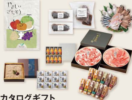
カタログギフト やさしいごちそう(緑のえだまめ)