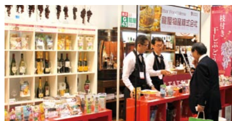
◀2小間出展イメージ